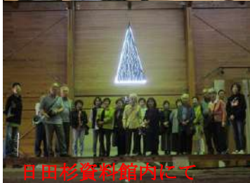
日田杉資料館内にて