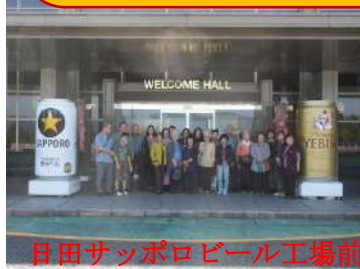
日田サッポロビール工場前