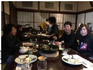
お昼は「旅籠 かやうさぎ」にて 庄屋の家を改装した趣ある建物でした