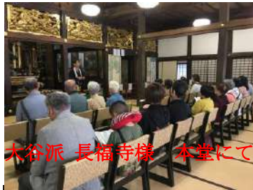
大谷派 長福寺様 本堂にて

みんなと一緒にの観光、食事は楽しくてありがたい一日でした。豆田の真宗寺院参拝させていただきました。