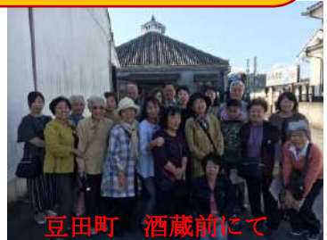
豆田町 酒蔵前にて